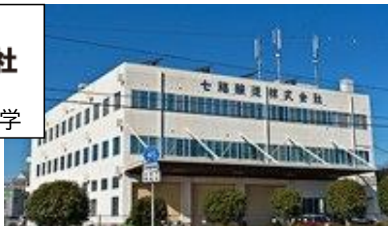
【裏面もご覧ください】